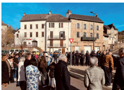
Commémorations du 11-novembre...