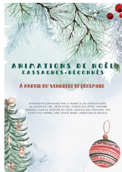
Festivités de Noël : programme d'animation porté par les associations et la mairie.