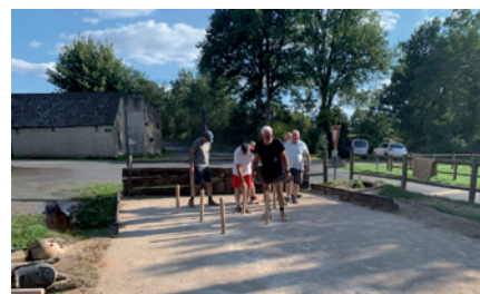
Création d'un quillodrome au Bousquet.