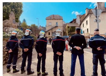
... et du 8-mai.