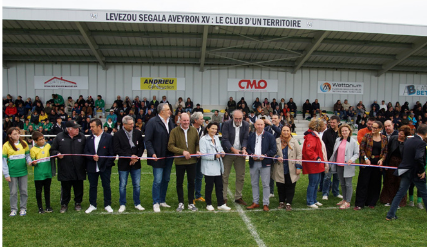
L'inauguration des nouvelles tribunes.

Vous aimez le rugby, la convivialité, le partage, rejoignez-nous sur et autour des terrains. Nouvelles joueuses, nouveaux joueurs, éducateurs débutants,