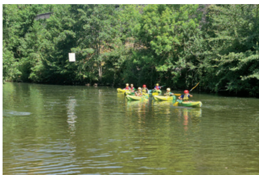
Sortie à Najac organisée lors des rencontres participatives jeunes