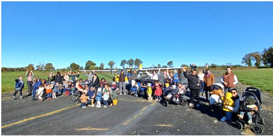
Le Relais petite enfance Pays Ségali a réuni ses quatre sites pour une sortie à l'aérodrome de Cassagnes-Bégonhès, pour le plus grand plaisir des petits et grands.

Pour l'occasion, les enfants ont eu le grand plaisir de s'approcher d'un ULM et d'y monter le temps d'une photo souvenir. Puis l'engin s'est envolé pour effectuer quelques boucles au-dessus de leurs têtes avant d'atterrir devant des yeux ébahis et remplis d'étoiles. Pour finir cette matinée hors