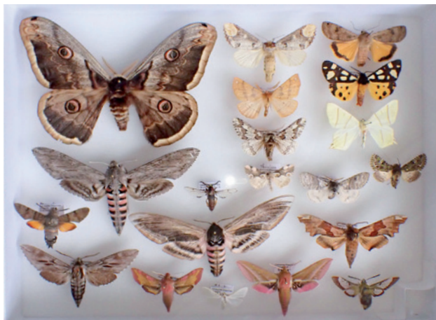
Papillons essentiellement nocturnes récoltés à Cassagnes-Bégonhès.

Il est évident qu'il existe une réelle distorsion d'une part entre les territoires, certains très parcourus par les