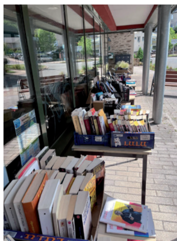
Vente de livres et troc de plantes.