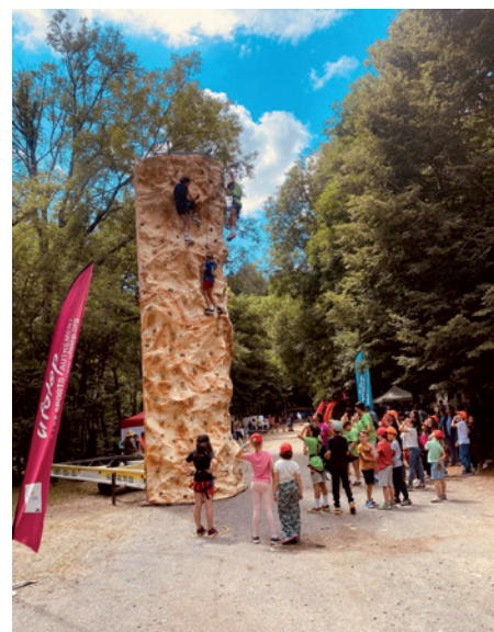
Caravane du sport