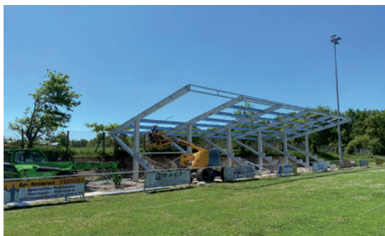
Tribunes du stade Louis-Bernad en chantier (inauguration des tribunes : cf. p. 19).