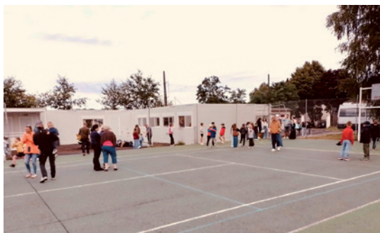
L'école des Chênes a déménagé à l'école « aux champs », à côté du stade de foot, le temps des travaux de rénovation.